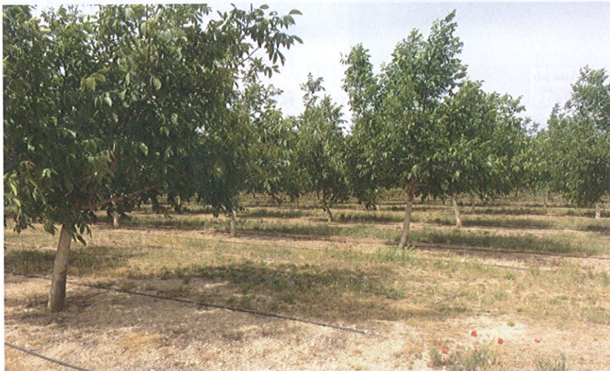
Foto 2 Plantación intensiva de nogales de 15 ha en Villagarcía de Campos (Valladolid)

NDMI, el peso de la nuez es mayor en el intervalo Bajo, mientras que el contenido en fósforo es mayor en el intervalo Alto, en ambos casos con diferencias significativas ( Tabla 1 ). Las nueces producidas en la zona con el NDMI Alto contienen niveles mayores de grasa, fósforo, magnesio y zinc. Los frutos producidos en la zona con valores de NDMI bajos contienen mayor contenido en hidratos de carbono, fibra, proteínas y hierro. Por otro lado, en el estudio del índice de clorofila NPCRI, los frutos del intervalo Alto alcanzan un contenido en zinc significativamente más alto que los del